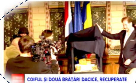
COIFUL ȘI DOUĂ BRĂȚĂRI DACICE, RECUPERATE